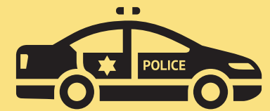
PATRULLA DE POLICÍA