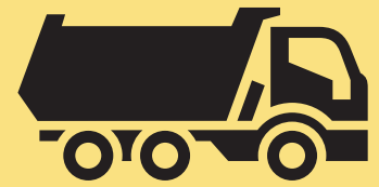
CAMIÓN DE BASURA