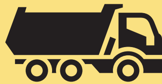
CAMIÓN DE BASURA