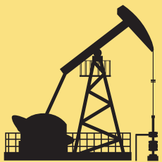
BOMBA DE PETRÓLEO