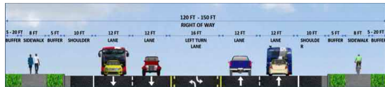
Sección Propuesta de la Carretera