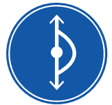
Ruta de Alivio