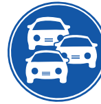
Movilidad y Congestión