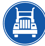
Movilidad de Carga