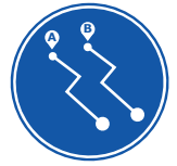
Redundancia de Red